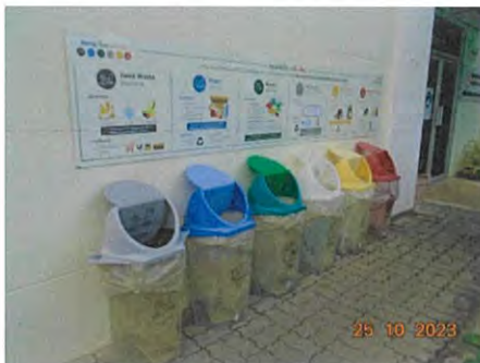
ภาชนะรองรับมูลฝอย