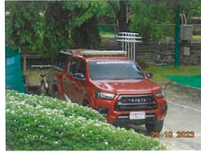
ภาพที่ 2-38 รถฉุกเฉิน