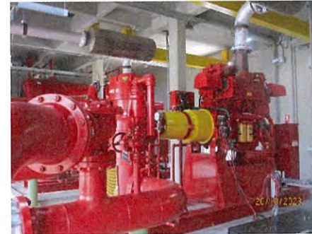
ภาพที่ 2-36 ปั๊มดับเพลิง (Fire Pump)