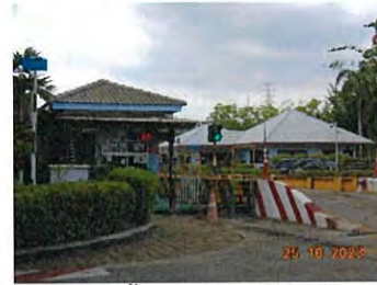
ด่านซังน้ำหนักรถบรรทุกขนส่ง