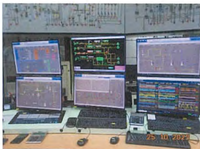
ภาพที่ 2-19 แผงควบคุมการทำงานของเครื่องจักร