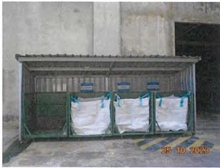
โพลิเมอร์นอกเกรด