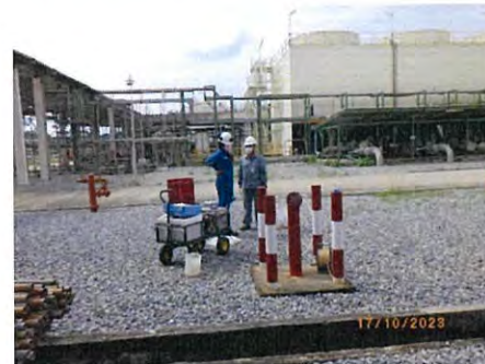
ภาพที่ 2-5 บ่อตรวจวัดคุณภาพน้ำใต้ดินของพื้นที่ TPE Site1