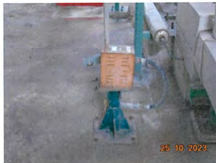
ภาพที่ 2-24 Gas Detector