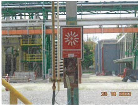
ภาพที่ 2-28 Fire Alarm