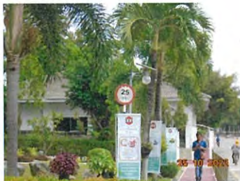
ป้ายจำกัดความเร็ว