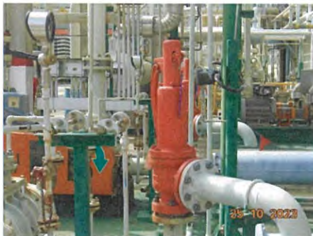
ภาพที่ 2-17 Safety Valve