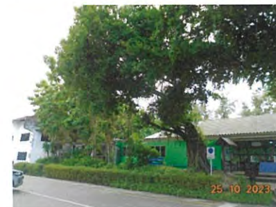
ภาพที่ 2-41 พื้นที่สีเขียว