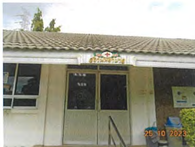
ภาพที่ 2-39 สถานพยาบาล