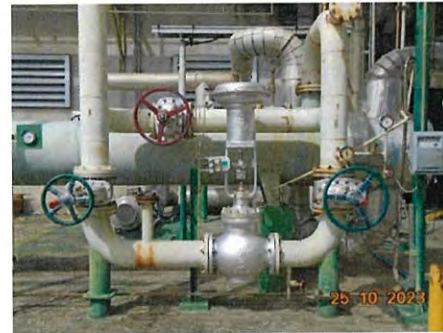
ภาพที่ 2-23 Block Valve ของระบบท่อลำเลียง