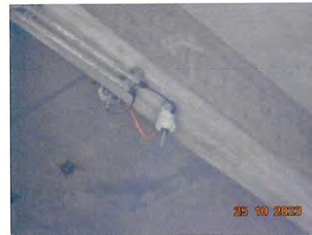
ภาพที่ 2-25 Heat Detector