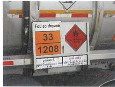
ภาพที่ 2-14 หมายเลขโทรศัพท์ที่รถขนส่งสารเคมี