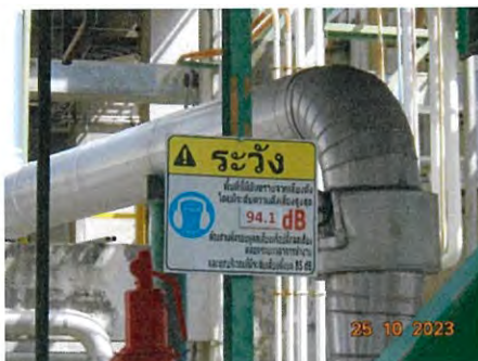
ภาพที่ 2-7 ป้ายเตือนพนักงานสวมใส่อุปกรณ์ป้องกันเสียง