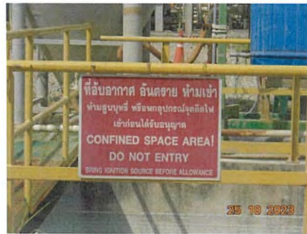
ภาพที่ 2-29 เขตพื้นที่หวงห้าม