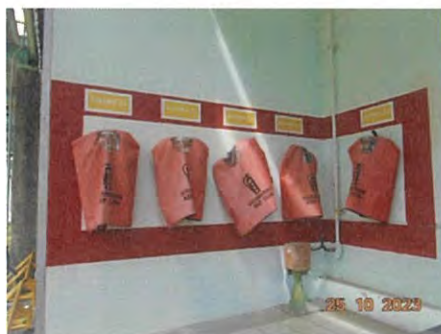
ภาพที่ 2-34 อุปกรณ์ดับเพลิง และระบบตอบโต้เหตุฉุกเฉิน