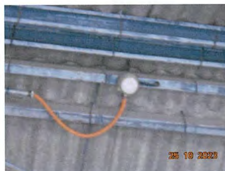
ภาพที่ 2-26 Smoke Detector