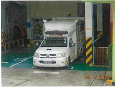
ภาพที่ 2-37 รถพยาบาล