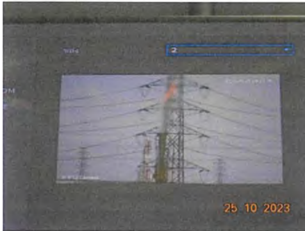
ภาพที่ 2-1 CCTV สำหรับตรวจสอบเปลวไฟของ Flare