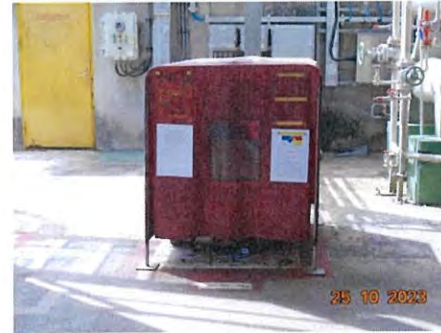
ภาพที่ 2-34 (ต่อ) อุปกรณ์ดับเพลิง และระบบตอบโต้เหตุฉุกเฉิน