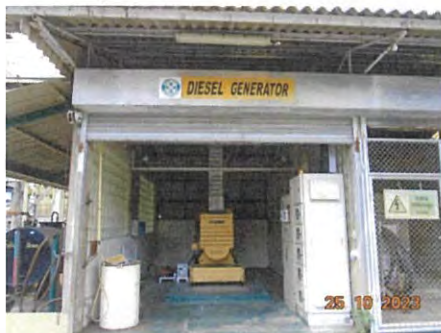
ภาพที่ 2-32 ระบบไฟฟ้าสำรอง (Diesel Generator)