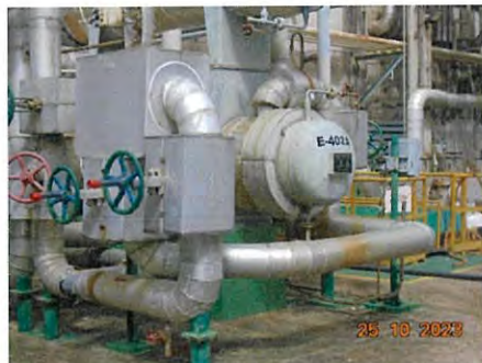
ภาพที่ 2-6 การติดตั้ง Insulation