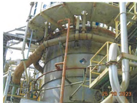
ภาพที่ 2-18 ระบบฉีบน้ำภายนอกถังปฏิกรณ์