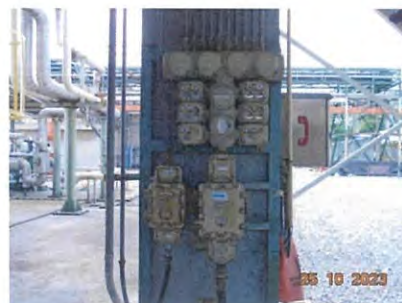
ภาพที่ 2-20 ระบบไฟฟ้าแบบ Explosion Proof