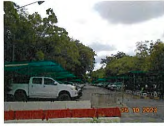
ลานจอดรถยนต์