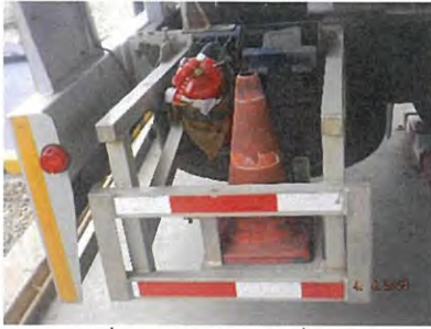
ภาพที่ 2-13 ถังดับเพลิงที่รถขนส่ง