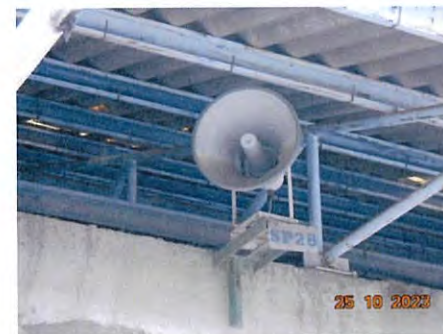
ภาพที่ 2-27 Siren