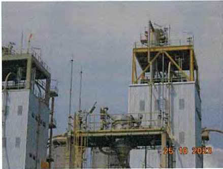
ภาพที่ 2-21 ระบบป้องกันฟ้าผ่าและระบบสายดิน