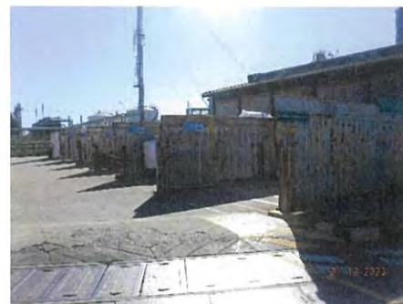
ของเสียแยกประเภท