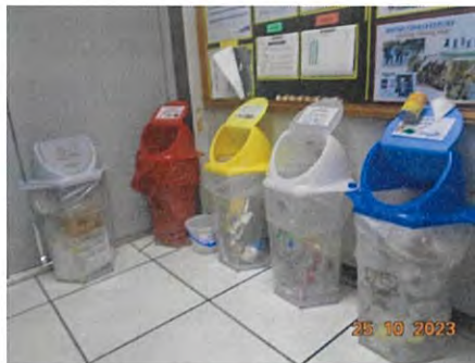
ภาชนะรองรับมูลฝอย