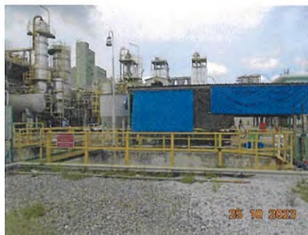
ภาพที่ 2-3 ระบบบำบัดน้ำเสีย