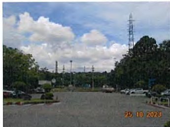
ลานจอดรถบรรทุก