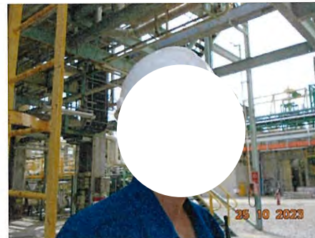
ภาพที่ 2-8 พนักงานสวมใส่อุปกรณ์ป้องกันเสียง