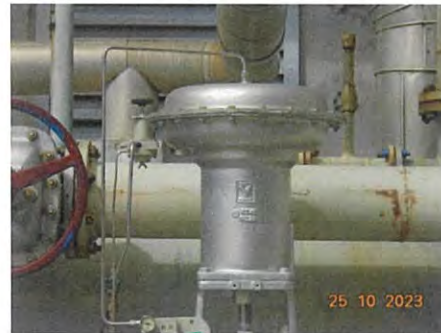
ภาพที่ 2-2 Control Valve