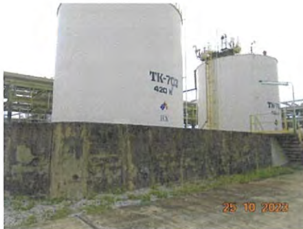
ภาพที่ 2-30 Bund Wall บริเวณถังเก็บสารเคมี