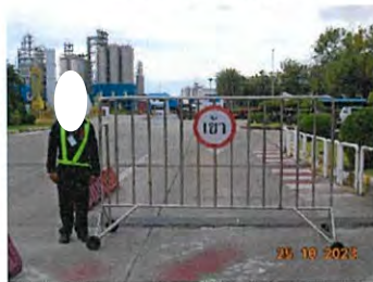
พนักงานรักษาความปลอดภัย