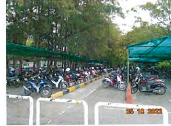
ลานจอดรถจักรยานยนต์