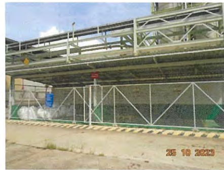
ของเสียอันตราย