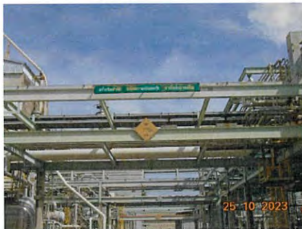
ภาพที่ 2-22 ท่อลำเลียงอยู่บนฐานรองรับเหนือพื้นพร้อมป้ายเตือนจำกัดความสูง