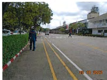
การตีเส้นบนพื้นถนนกำหนดเส้นทางเดิน