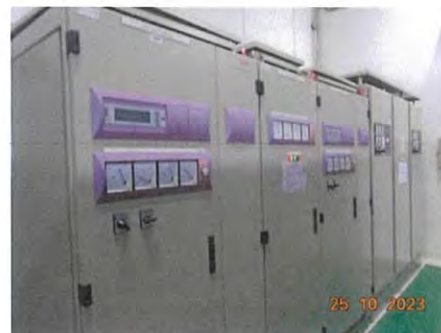
ภาพที่ 2-33 ระบบไฟฟ้าสำรอง (UPS)