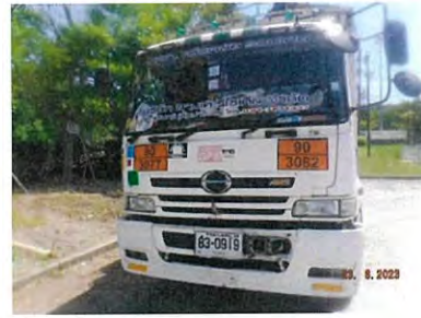
ภาพที่ 2-11 หมายเลขโทรศัพท์ที่รถของส่งกากของเสีย