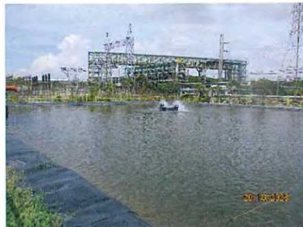
ภาพที่ 2-35 บ่อน้ำดับเพลิงสำรอง (Fire Pond)