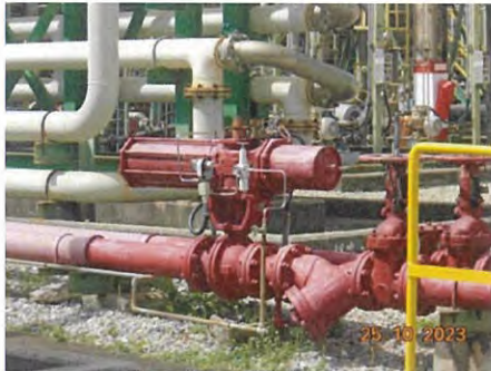
ภาพที่ 2-15 Interlock Valve