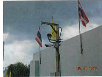
ระบบ CCTV เพื่อดูแลด้านการจราจรบริเวณทางเข้าออก