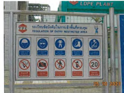
ภาพที่ 2-40 ป้ายเตือนการสวมใส่อุปกรณ์คุ้มครองความปลอดภัยส่วนบุคคล