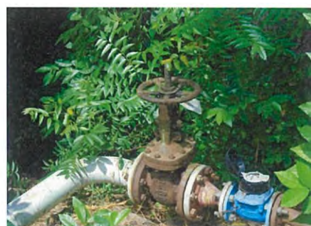
ภาพที่ 2-4 ท่อน้ำเสียที่ส่งไปบำบัดยัง บริษัท พีทีที โกลบอล เคมิคอล จำกัด (มหาชน)