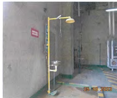
ภาพที่ 2-31 Safety Shower Eye Washer