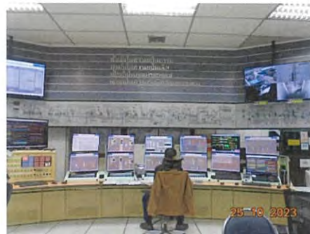
ภาพที่ 2-16 การตรวจสอบและควบคุมกระบวนการผลิตที่ CCR ด้วยระบบ DCS